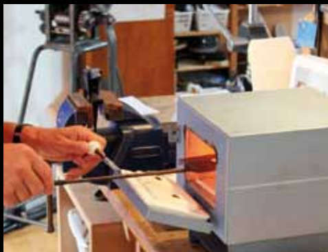
Brændingen foregår i en speciel ovn ved en temperatur på 850 grader.