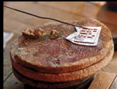
Motivet loddes på sølvplade. Underlaget, en scamlaxsten, tåler 830 grader, der er sølvets smeltepunkt.