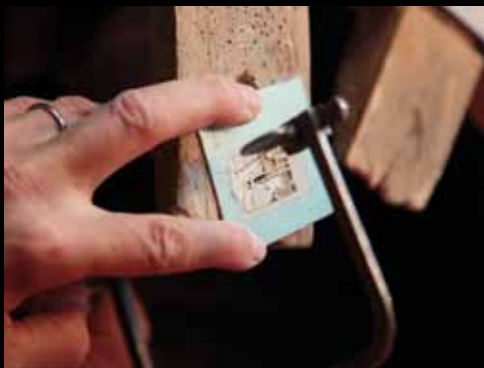
Med en savklinge, der blot er 1/5 mm bred savs motivet ud i sølvpladen