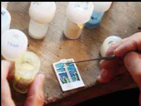
Emaljefarverne lægges i de små hulrum med en tynd pensel