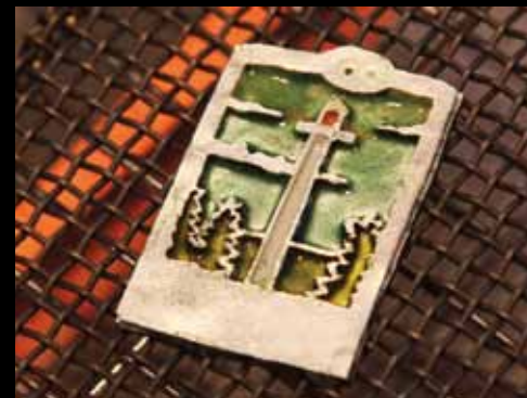
Den høje temperatur forandrer farverne, men i forbindelse med nedkølingen får emaljemotivet de rette nuancer