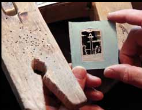
Det udsavede, transparente motiv