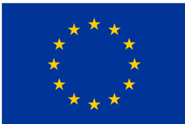
Den Europæiske Union