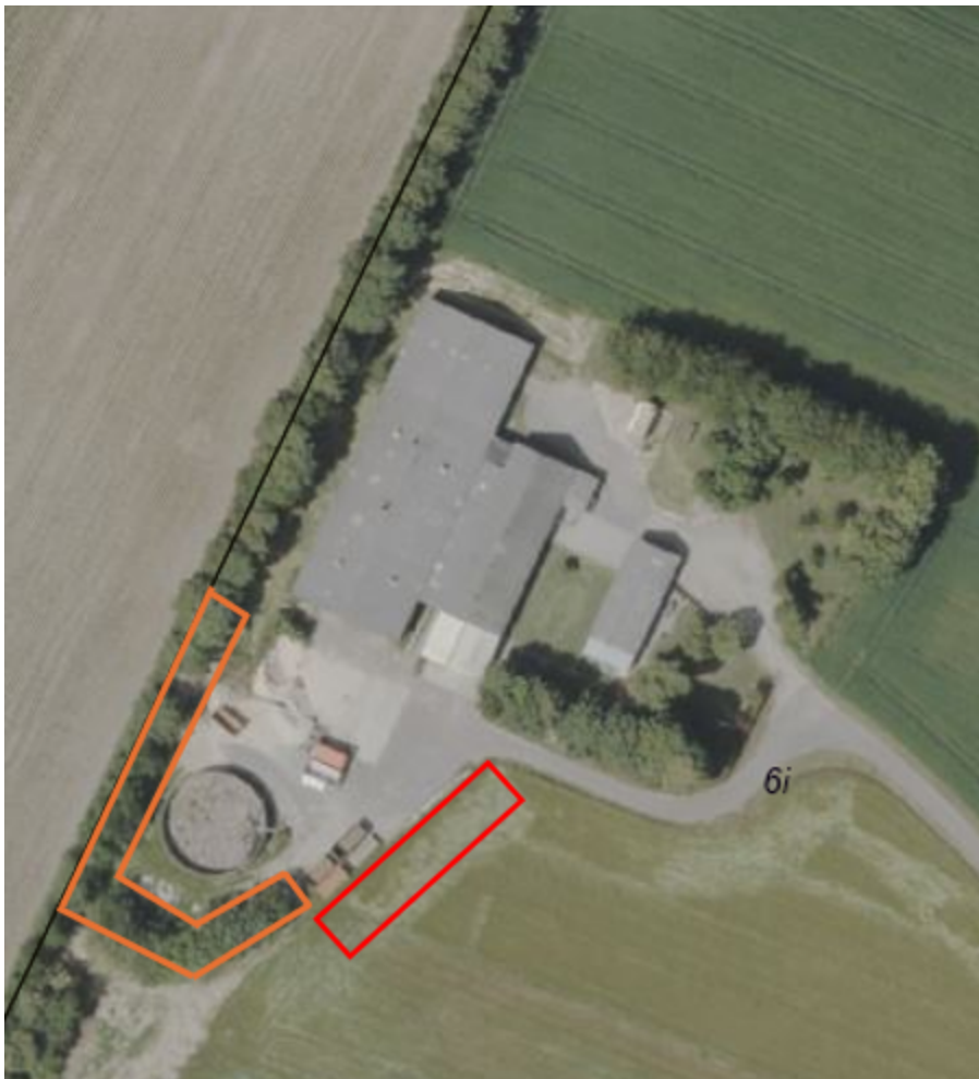
Figur 2: Den eksisterende beplantning, der skal bevares, ses i det orange omrids. Det nye beplantningsbælte skal etableres i det røde omrids.