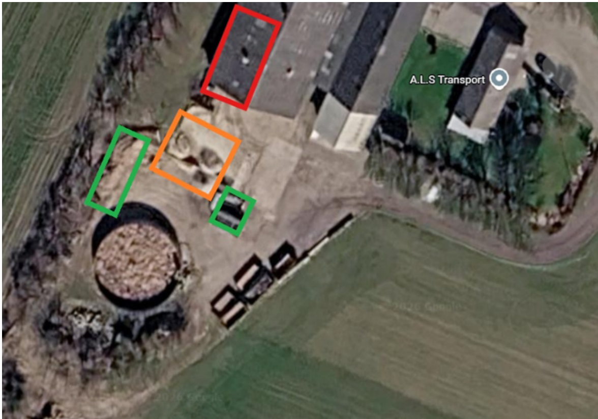
Figur 1: De grønne felter markerer placering af containerne. Det orange felt markerer placering af oplaget. Det røde felt markerer placering af de to anhængere og kranen i hallen.