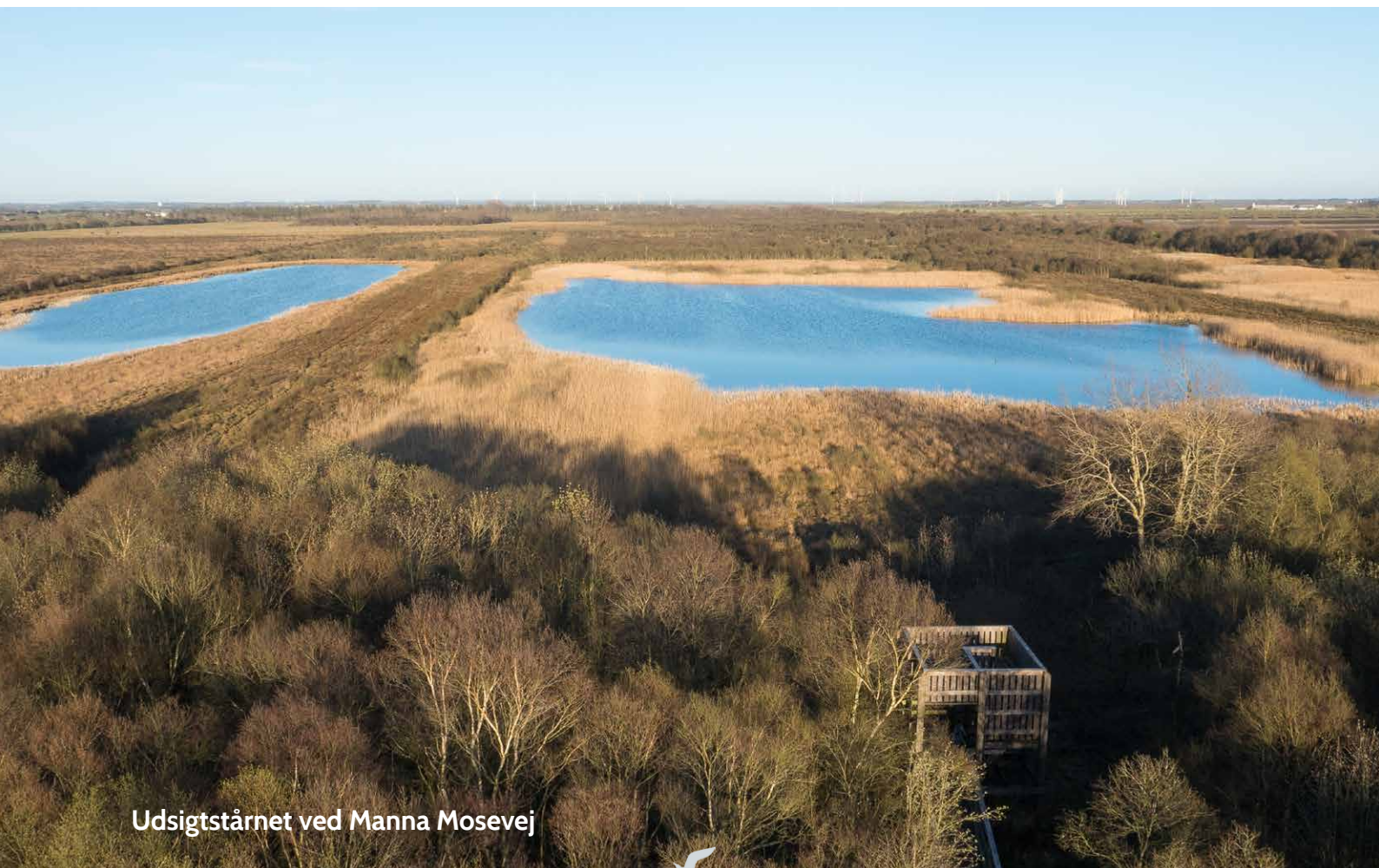
Udsigtstårnet ved Manna Mosevej

*Naturstyrelsens indsats beskrives i bilag 1.