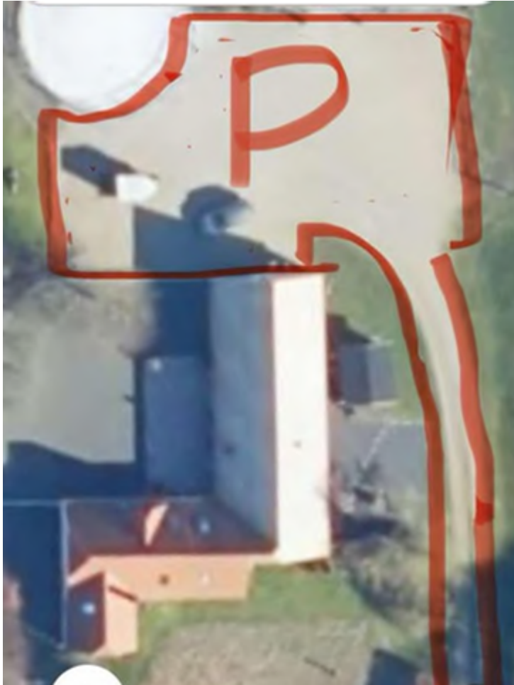
Figur 5: Grusplads til parkering - ikke målfaste