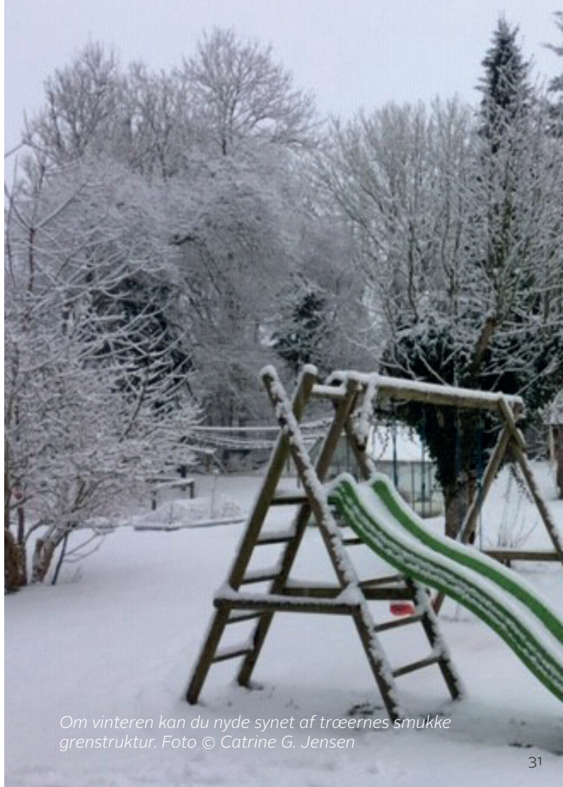
Om vinteren kan du nyde synet af træernes smukke grenstruktur.