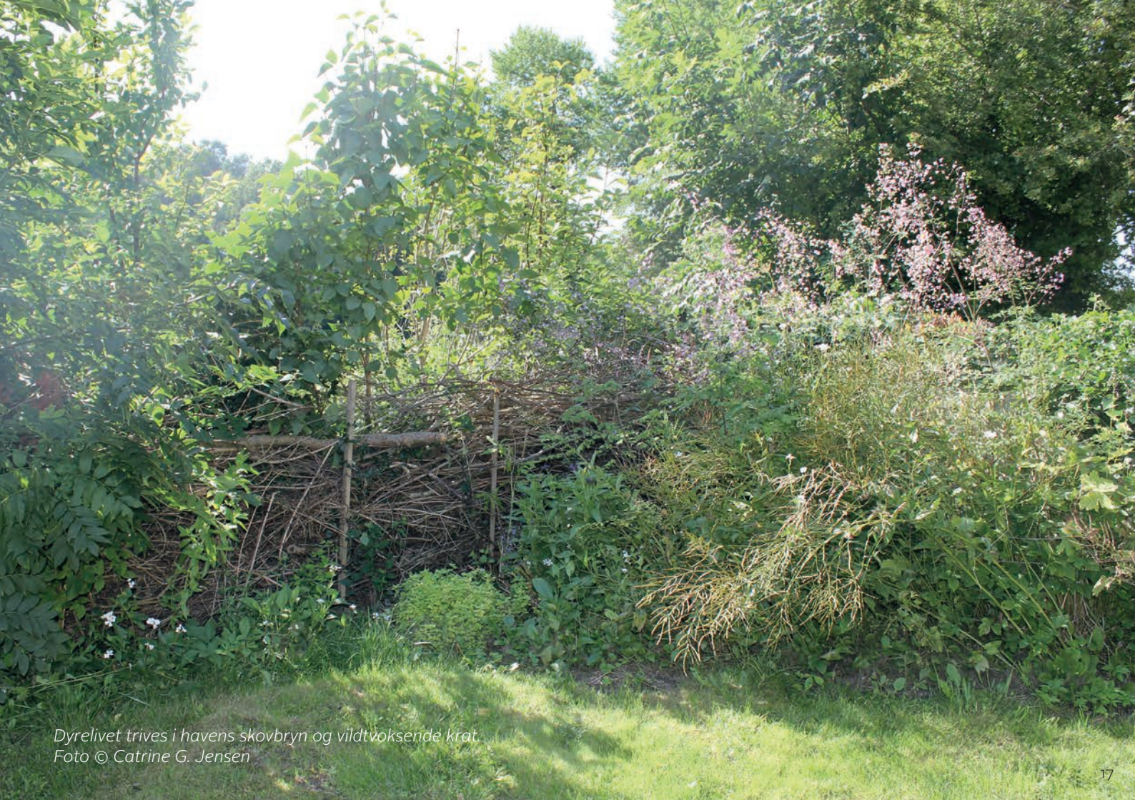
Dyrelivet trives i havens skovbryn og vildtvoksende krat.