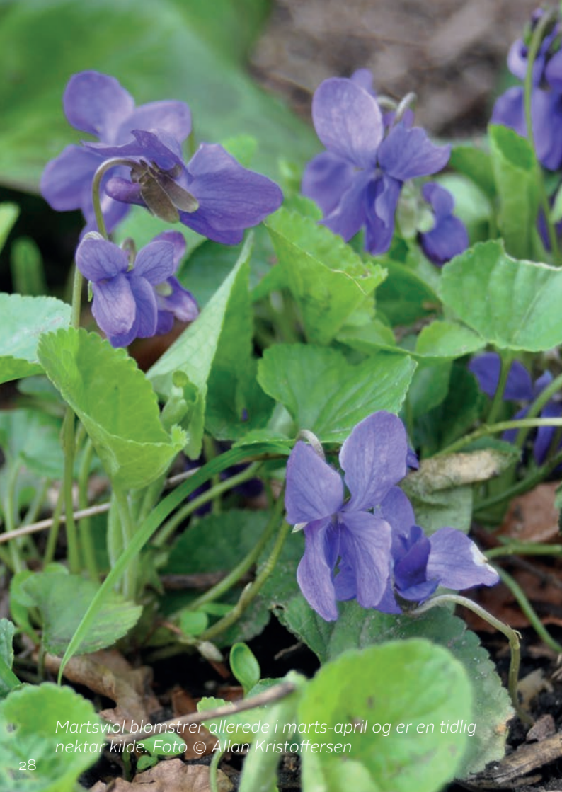
Martsviol blomstrer allerede i marts-april og er en tidlig nektar kilde.