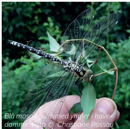
Blå mosaikguldsmed yngler i havedamme.