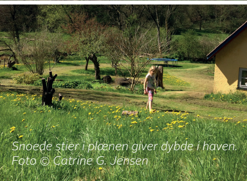
Snoede stier i plænen giver dybde i haven.