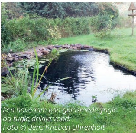
Fen havedam kan guldsmede yngle og fugle drikke vand.