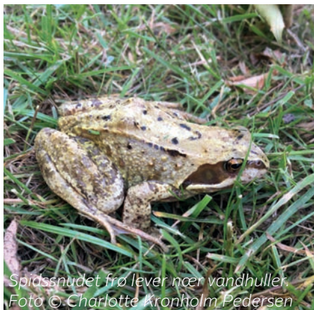
Spidsnudet frø lever nær vandhuller.