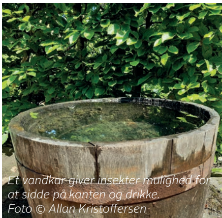
Et vandkar giver insekter mulighed for at sidde på kanten og drikke.