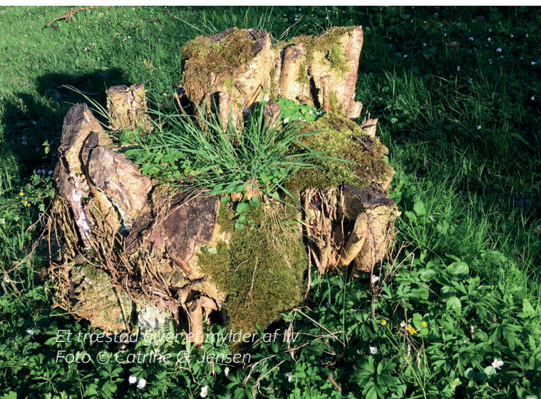
Et træstød bliver et nyder af liv