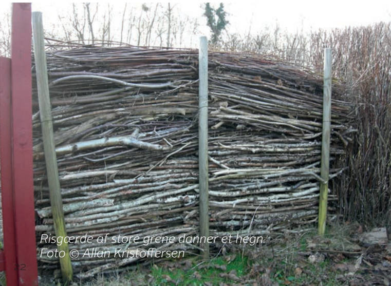
Risgærde af store grene danner et hegn.

Risgærder kan bruges til at skabe mindre rum i haven. Rum til ro og fordybelse og rum til leg. Risgærder kan bruges til læ og som en væg, slyngplanter kan vokse op ad. Alt sammen imens der udfolder sig et mylder af liv inde i risgærdet.