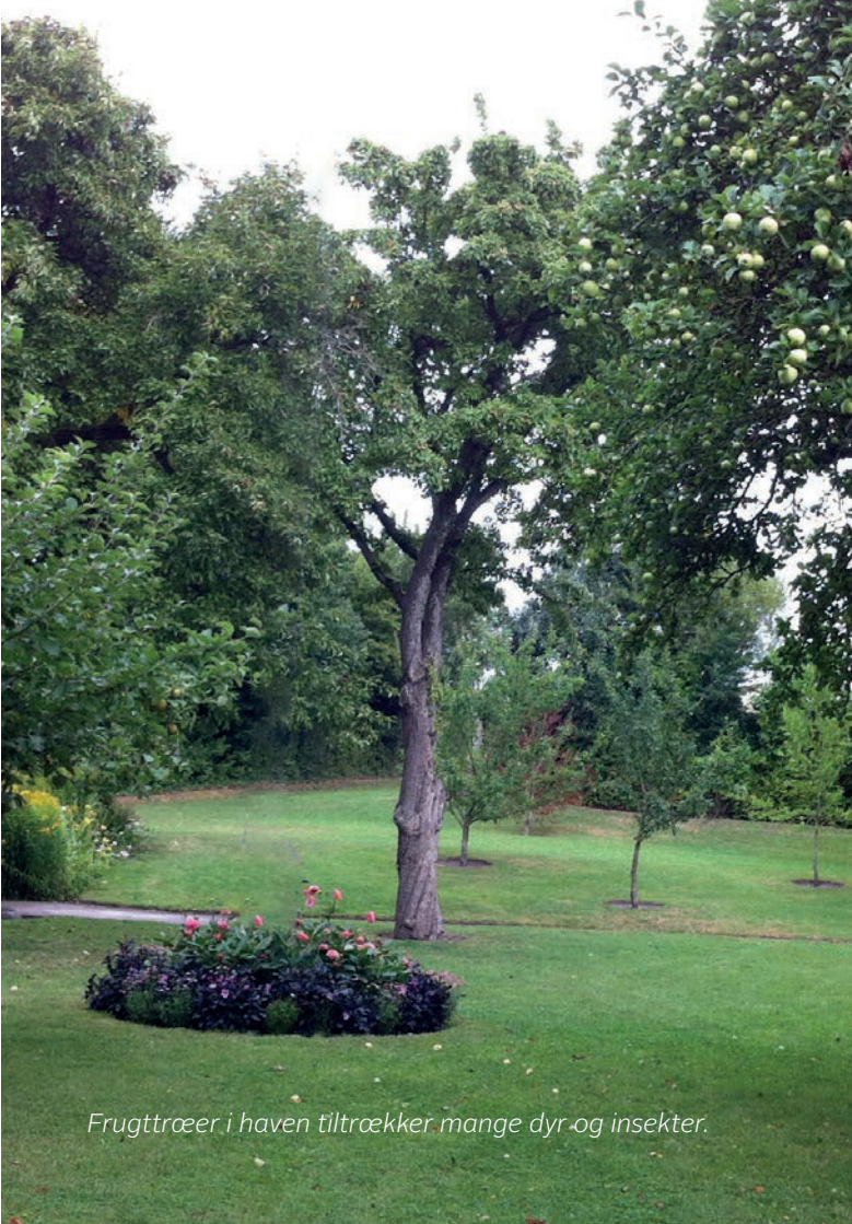
Frugttroer i haven tiltrokker mange dyr og insekter.