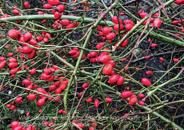
Vildrose danner krat, hvor småfugle kan gemme sig.