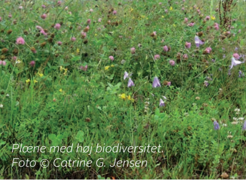
Plæne med høj biodiversitet.