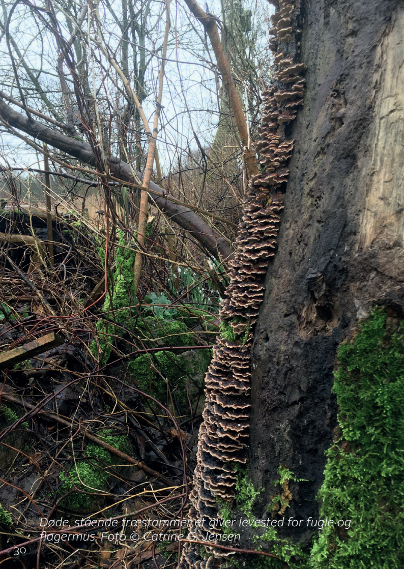
Døde, stående træstammer, et giver levested for fugle og flagermus.