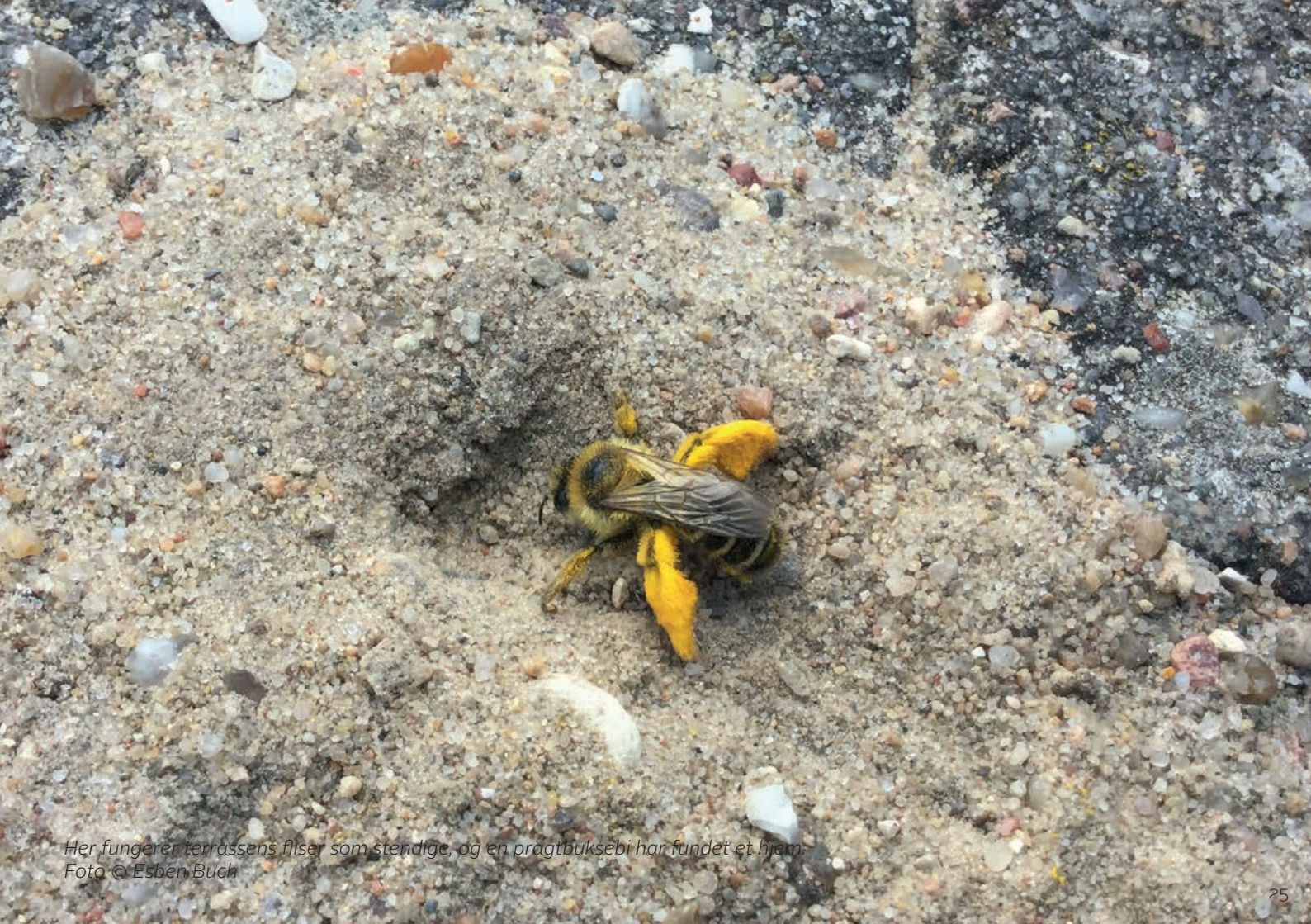
Her fungerer terræssens fliser som stendige, og en prægtbuksebi har fundet et hjem.