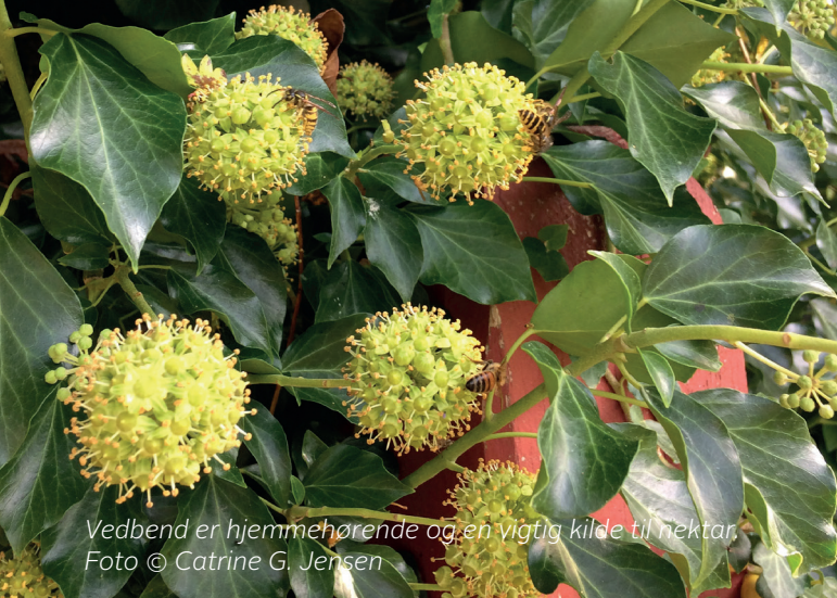
Vedbend er hjemmehørende og en vigtig kilde til nektar.