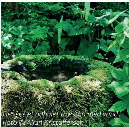
Her ses et udhulet træstød med vand.