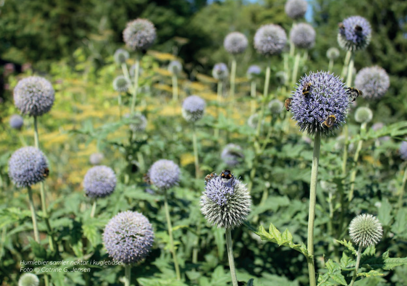
Humblebier samler nektar i kugletidse.