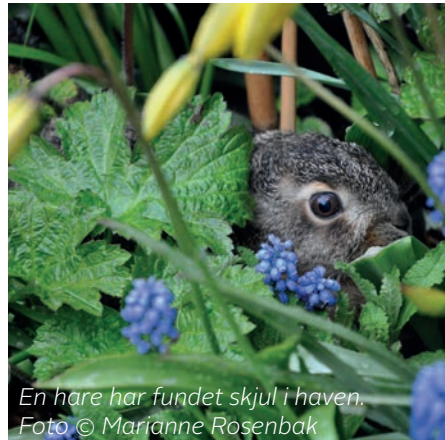
En hare har fundet skjul i haven.

Haren foretrækker en græsplæne med forskellige græsser og vilde urter. Om vinteren tager haren skud og bark fra frugttræer og bruger buske til sit skjul. Den finder en fordybning i vegetationen, 'et sæde', hvor den er godt kamufleret med læ og udsyn til omgivelserne.