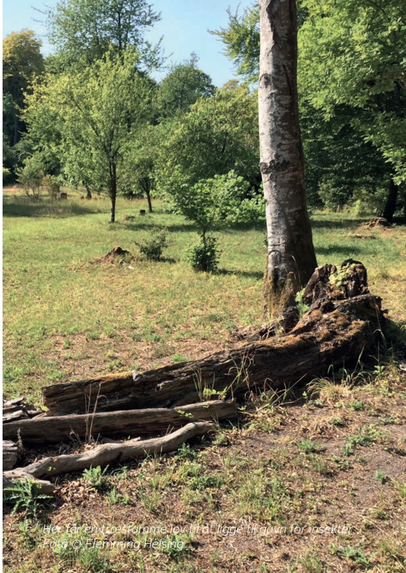
Her får en træstamme lov til at ligge til gavn for insekter.