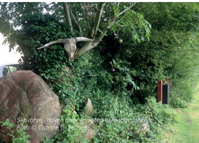
Skovbryn i haven giver levested til mange arter.

Jo mere vildt krattet er, jo mere plads er der til liv. Hvis du for eksempel undgår at klippe alle blomsterne af ligusterhækken, vil ligusterbær tiltrække fuglene om efteråret og vinteren. Hvis du tynder ud i krattet, kan du med fordel lade afklip og døde grene ligge som kvas i bunden til gavn for smådyr.