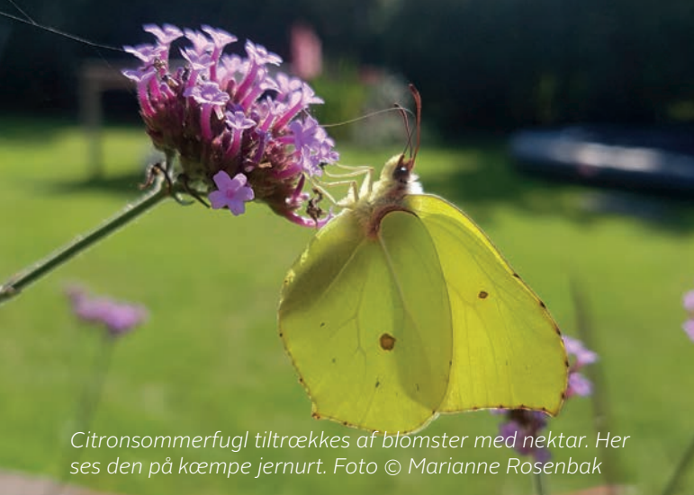
Citronsommerfugl tiltrækkes af blomster med nektar. Her ses den på kæmpe jernurt.