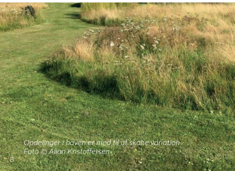
Opdelinger i haven er med til at skabe variation