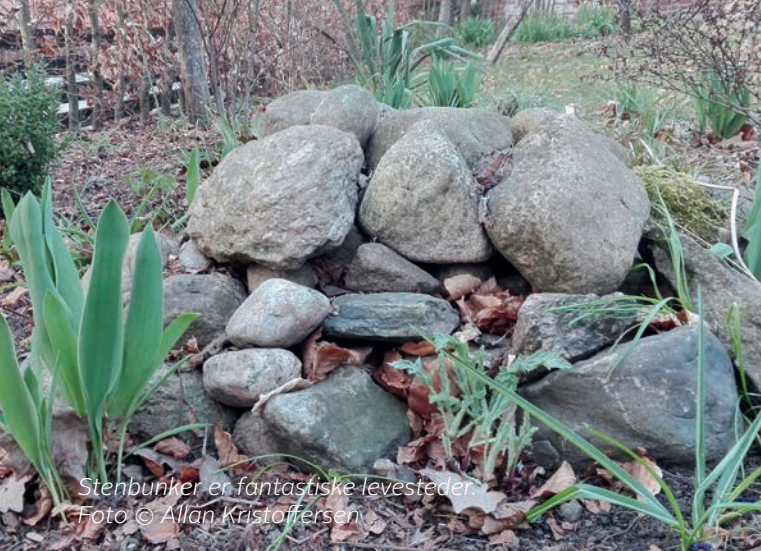
Stenbunker er fantastiske levesteder.