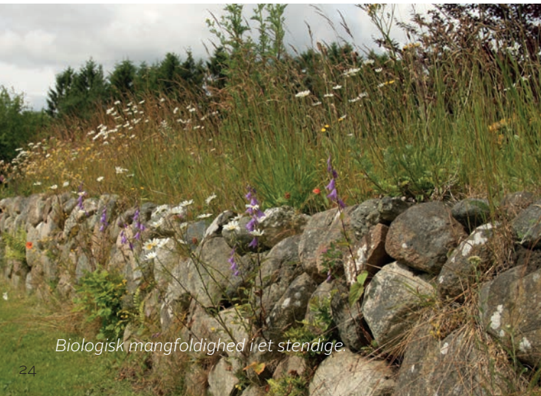
Biologisk mangfoldighed i et stendige.

Du kan lave stendiger, så de fremstår smukke i haven. Ligesom med risgærder kan de være med til at sikre rum i haven, afgrænse dele af haven imellem det vilde og det tæmmede og samtidig være gode levesteder. Stendiger kan bygges i alle former og størrelser, kun fantasien sætter grænser. Husk at tænke på stabiliteten, når du opbygger en stenbunke. Placer de største sten nederst og grav dem eventuelt lidt ned. Undgå brug af mørtel da det giver færre hulrum.