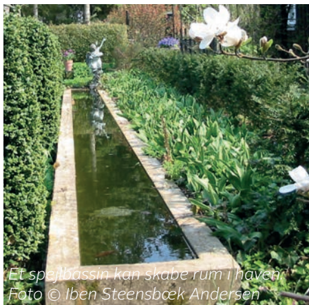
Et spejlbassin kan skabe rum i haven.