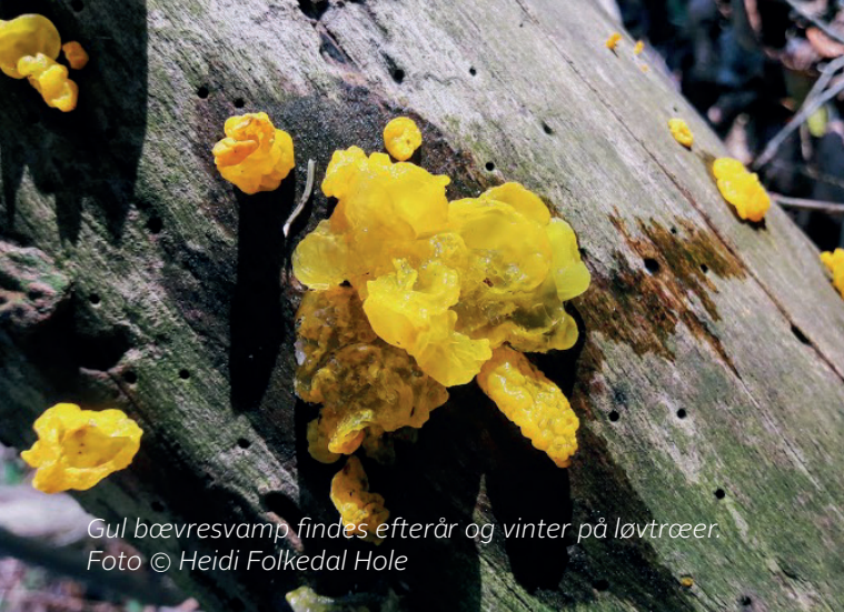
Gul bæuvresvamp findes efterår og vinter på løvtræer.