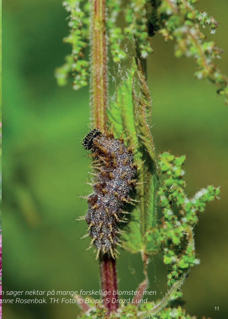
Admiralen er en af vores mest almindelige sommerfugle. Admiralen søger nektar på mange forskellige blomster, men dens larver lever udelukkende på brændenælde. TV: Foto © Marianne Rosenbak. TH: Foto © Biopix S Drozd Lund