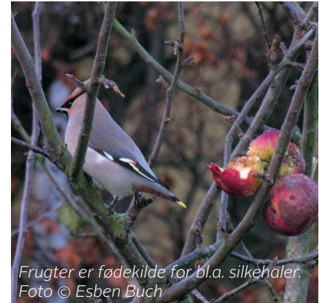
Frugter er fødekilde for bl.a. silkehaler.