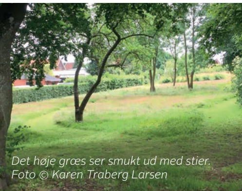
Det høje græs ser smukt ud med stier.