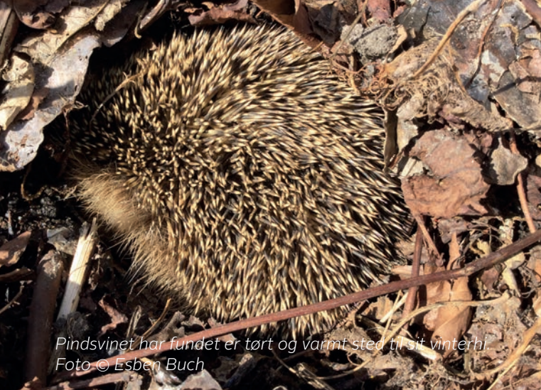
Pindsvinet har fundet et tørt og varmt sted til sit vinterhi.