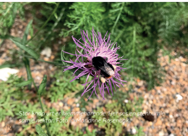
Stor knop urt er hjemmehørende. Her ses en stenhumle samle nektar.