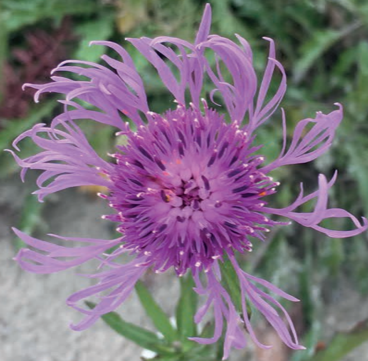
Stor knopurt vokser på næringsfattig, kalkrig jord. Dens frøstande giver føde til småfugle om vinteren.