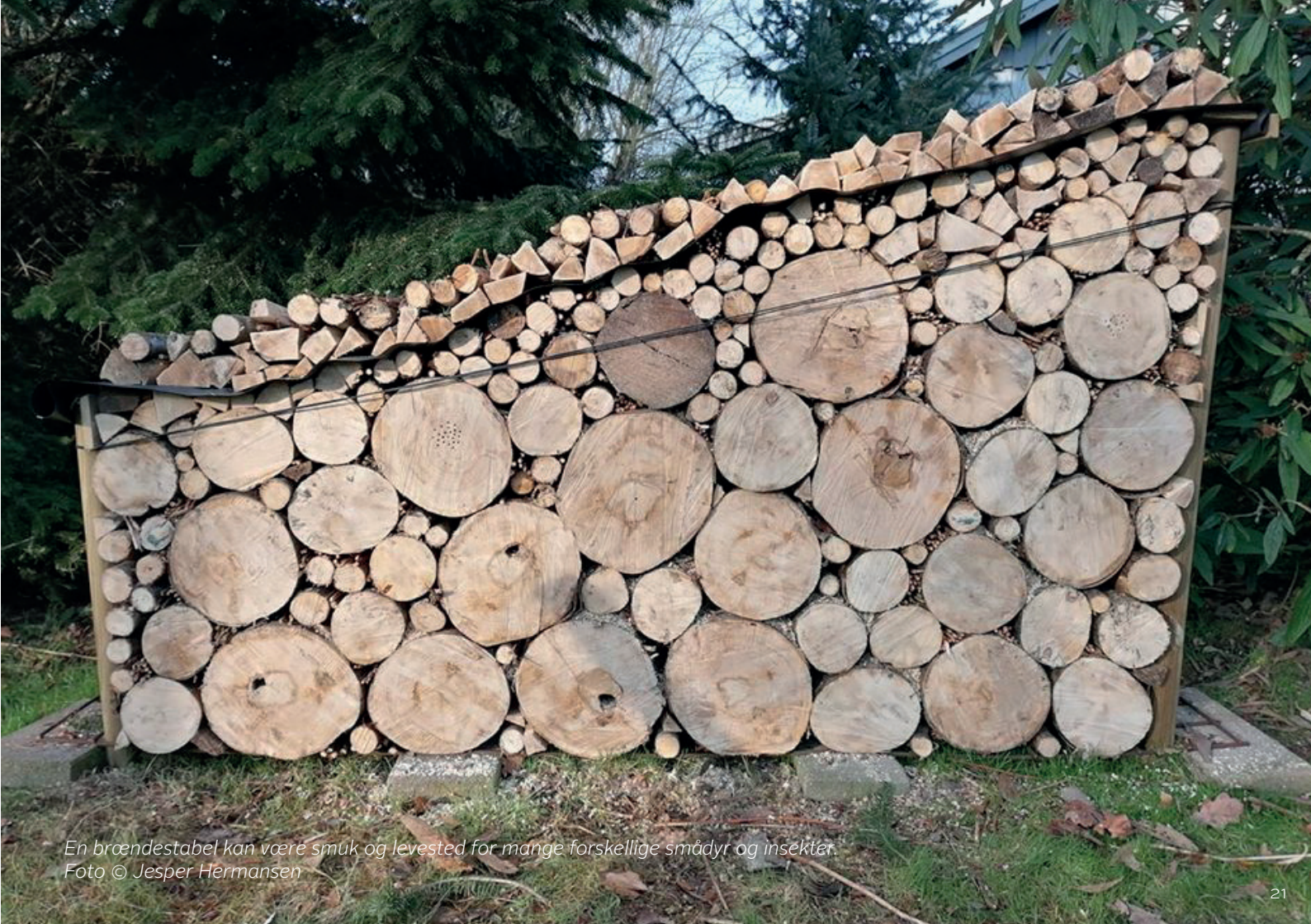
En brændestabel kan være smuk og levested for mange forskellige smådyr og insekter.