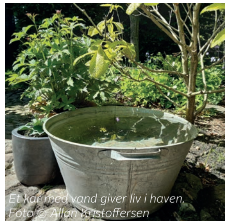
Et kar med vand giver liv i haven.