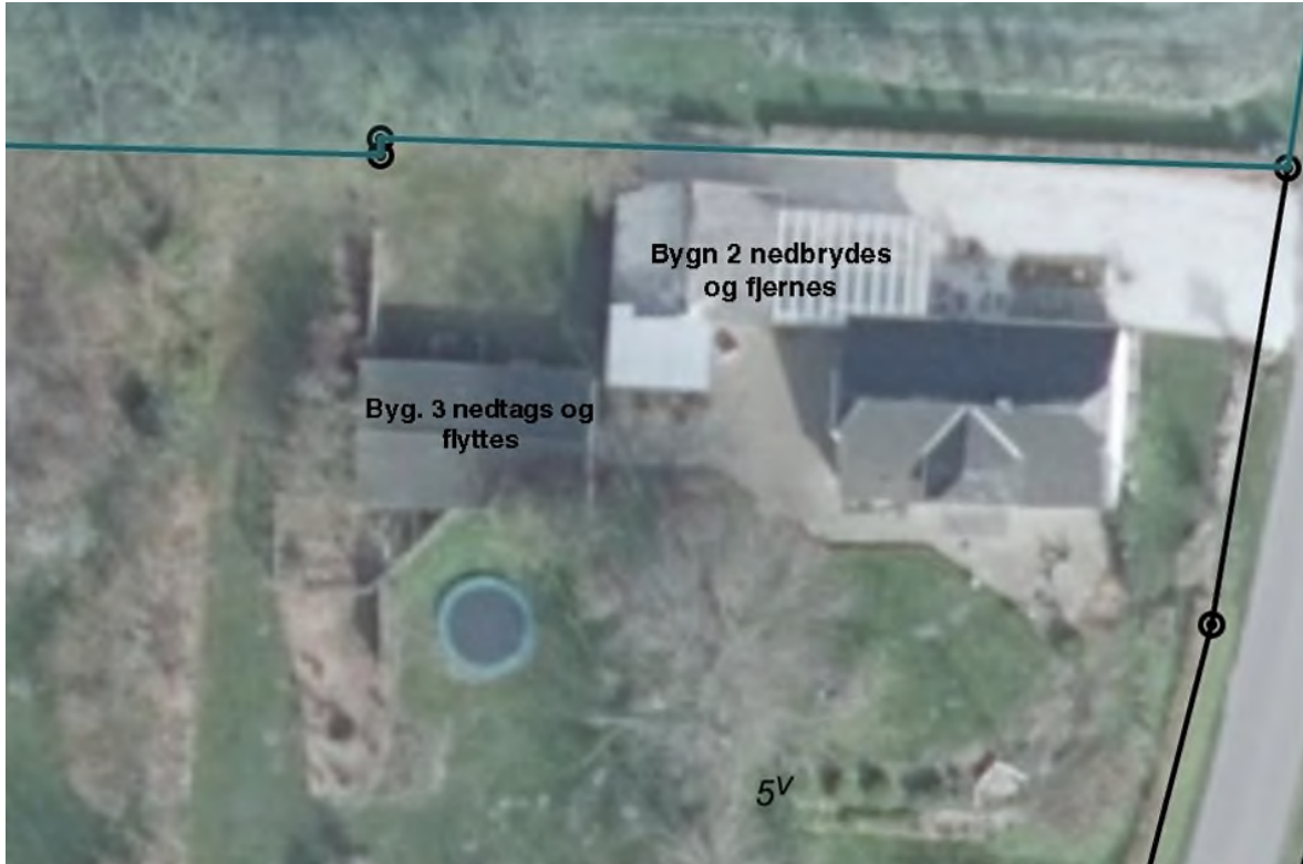
Figur 5: Eksisterende forhold - ikke målfast