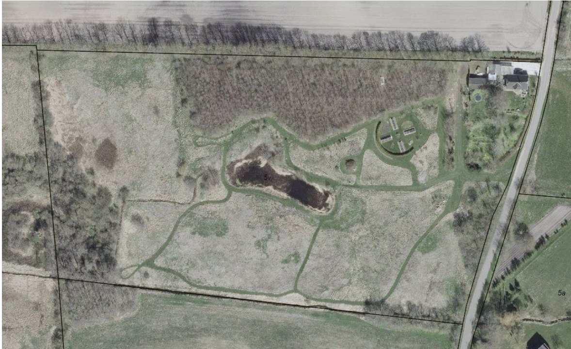
Figur 4: Luffoto, forår 2026 - ikke målfast