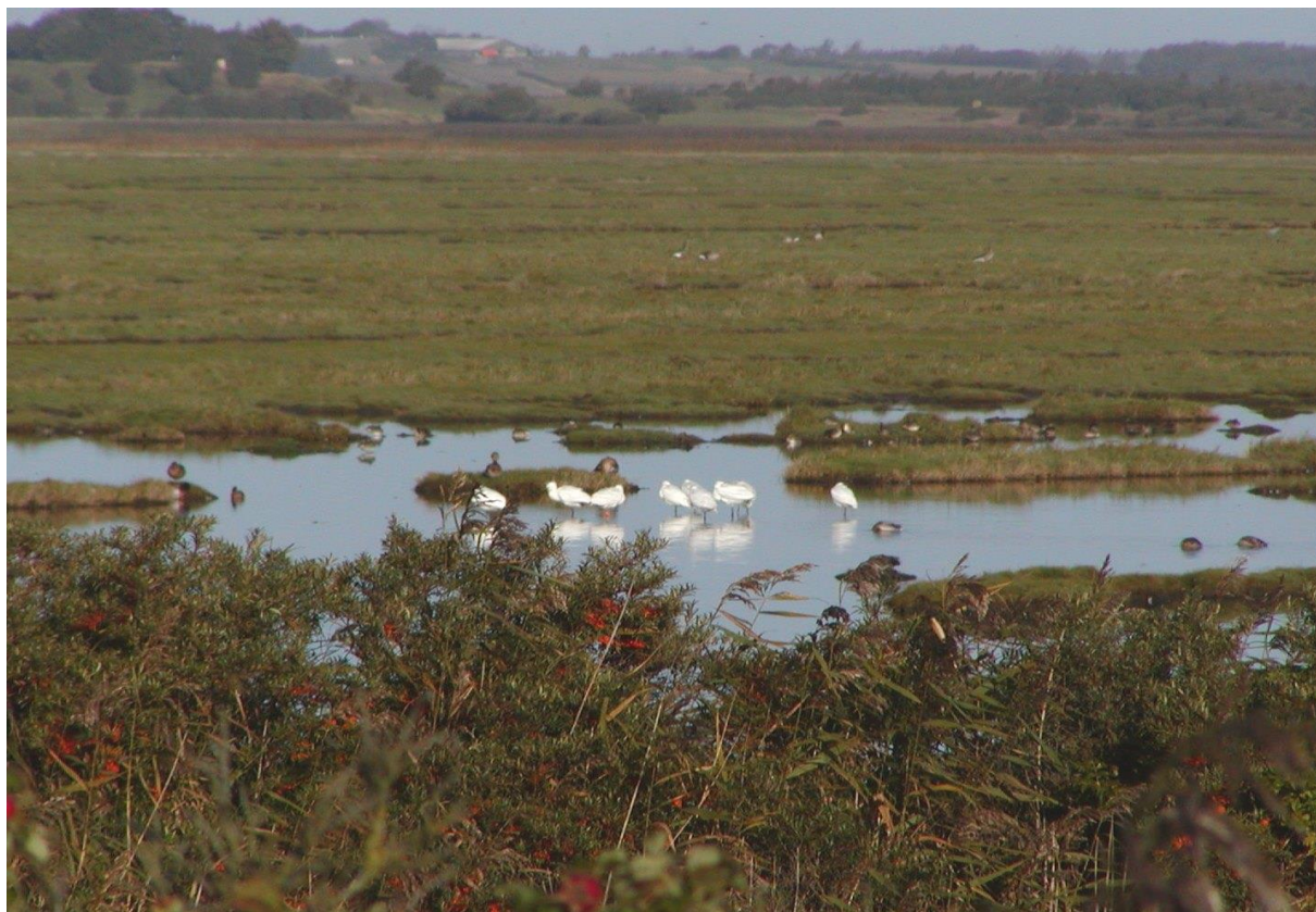
Figur 5: Skestork på Bygholm Vejle. Skestork er på udpegningsgrundlaget for Fuglebeskyttelsesområderne F13.

Området er med sine fem fuglebeskyttelsesområder en vigtig lokalitet for en lang række af yngle- og trækfugle (se bilag 2). En stor del af de nødvendige tiltag for disse arter vedrører vandstand og vandområder, hvilket skal varetages med vandplanerne, samt store uforstyrrede områder hvilket sikres gennem vildtreservaterne og den generelle drift af Vejlerne. Derudover er en stor del af disse fuglearter afhængige af afgræssede strandenge, hvorfor indsatsen for naturtyperne i væsentlig omfang forventes at bidrage til at sikre egnede levesteder for arterne.