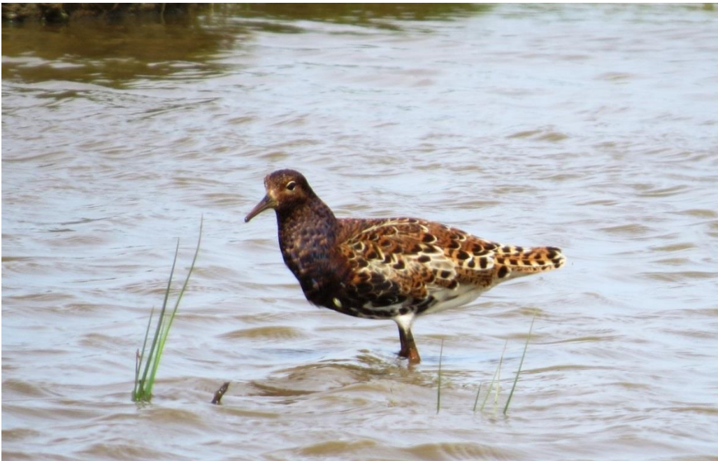
Figur 3: Brushane er en af arterne på udpegningsgrundlaget for fuglebeskyttelsesområderne F13 og F20.