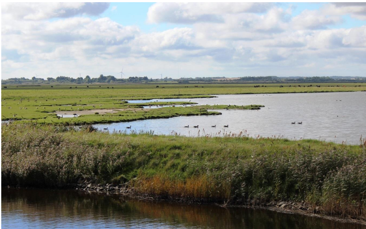
Figur 2: Udsigt over Bygholm Vejle. I baggrunden ses græssende kreaturer.

Den kommunale Natura 2000-handleplan er som udgangspunkt omfattet af krav om miljøvurdering i henhold til lov om miljøvurdering af planer og programmer (lovbekendtgørelse nr. 1533 af 10. december 2015). For samtlige statslige Natura 2000-planer er der foretaget en strategisk miljøvurdering. Handleplanerne har et indhold, der ikke adskiller sig fra de oplysninger, som allerede er givet i de miljøvurderede Natura 2000-planer. Da handleplanen ikke sætter nye rammer for fremtidige anlægstilladelser eller yderligere vil kunne påvirke internationalt udpegede naturbeskyttelsesområder væsentligt, har kommunerne truffet afgørelse om, at der ikke er behov for en fornyet miljøvurdering.