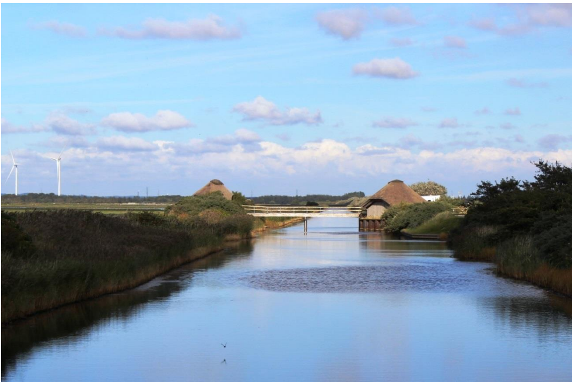
Figur 7: Glombak Kanal med udsigt til Åge V. Jensens naturcenter.

Kommunerne forventer at arbejde for et fortsat godt samarbejde med Aage V. Jensens Naturfond i forhold til videns udveksling omkring plejetiltag til gavn for de beskyttelseskrævende fugle på udpegningsgrundlaget.