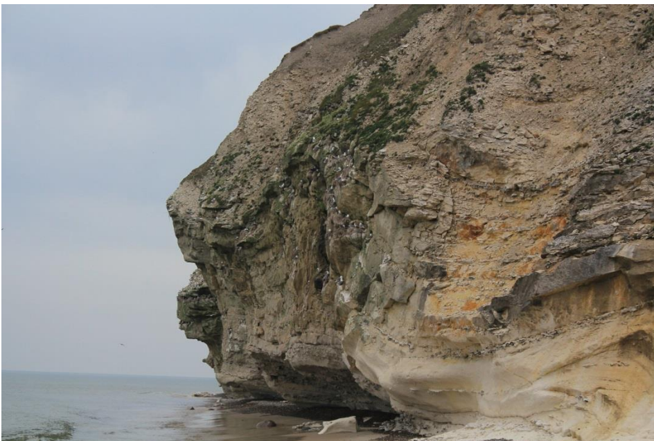
Figur 4: Bulbjerg Klint.

Naturstyrelsen har gennemført 37 indsatser i dette Natura 2000 område i perioden 2010-2015. Disse indsatser består af en række plejetiltag, herunder konvertering af skov til lysåbent natur, rydning af læhegn og vedligeholdende pleje med fjernelse af nåleopvækst, på et areal der udgør i alt 134 ha. Disse indsatser har bidraget positivt til opfyldelse af Natura 2000-planens målsætninger og har været til gavn for arter og naturtyper på udpegningsgrundlaget. En mere konkret redegørelse af Naturstyrelsens indsats kan ses på Naturstyrelsens hjemmeside .