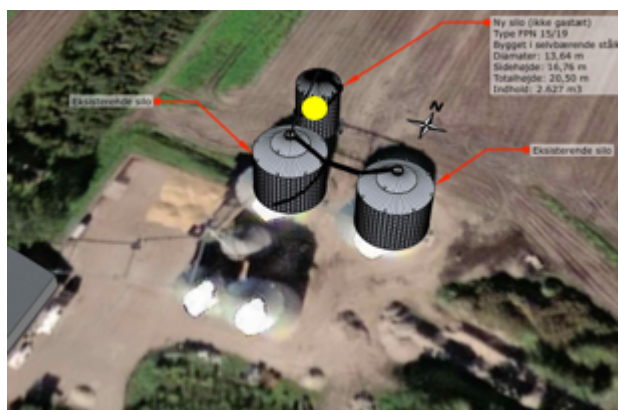
Figur 1: Placering af ny silo markeret med gul cirkel - ikke målfast.

Siloen placeres 10,7 meter fra eksisterende siloanlæg jf. figur 1.