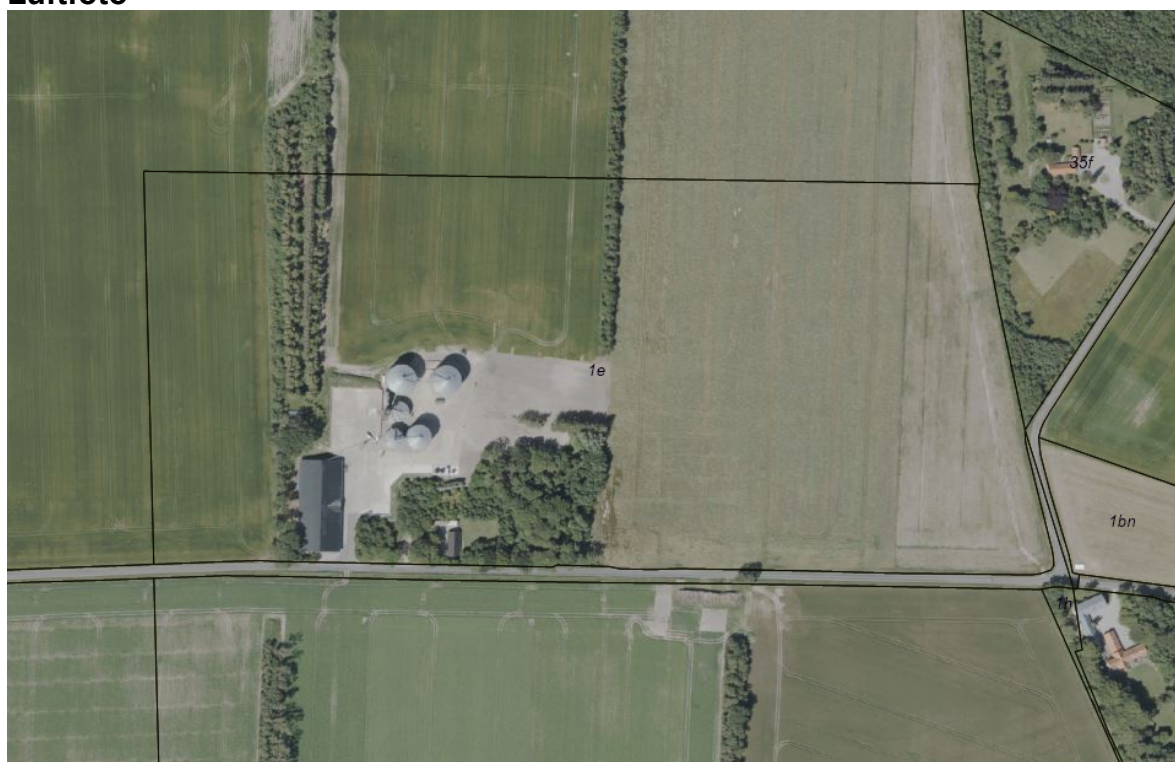
Figur 4: Luffoto, sommer 2025 - ikke målfast