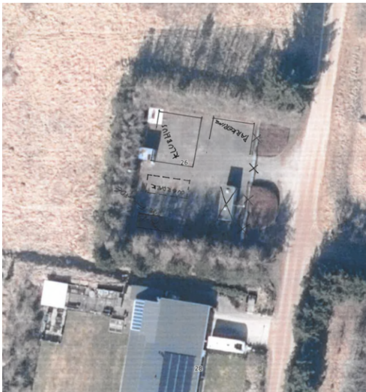
Figur 5: Situationsplan - ikke målfast