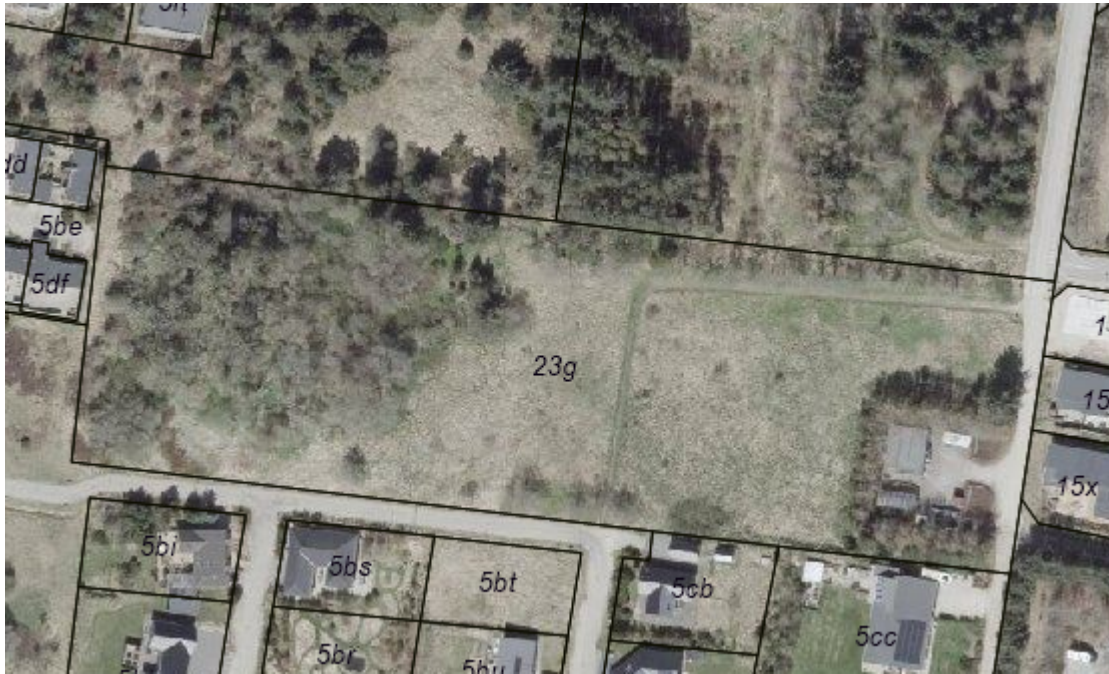
Figur 4: Luffoto, forår 2026 - ikke målfast