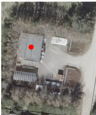
Figur 1: Placering af klubhuset markeret med en rød cirkel.

Der er ansøgt om forlængelse af midlertidig landzonetilladelse til opstilling af klubhus på 110 m 2 .