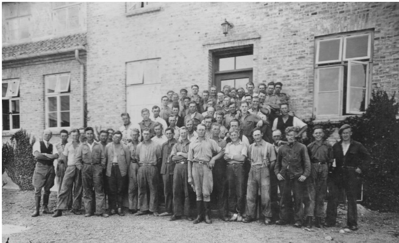
Billede – Medhjælpere i år 1940 foran hovedbygningen

Dette materiale er støttet af CANAPE, et Interreg projekt støttet af den Europæiske Unions Regionale Udviklingsfond