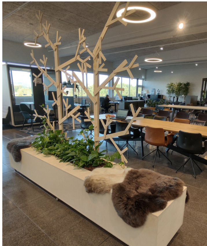
Denne bænk bliver med tiden til en levende væg, som planterne vokser til, op ad det gevirlignende ryglæn.