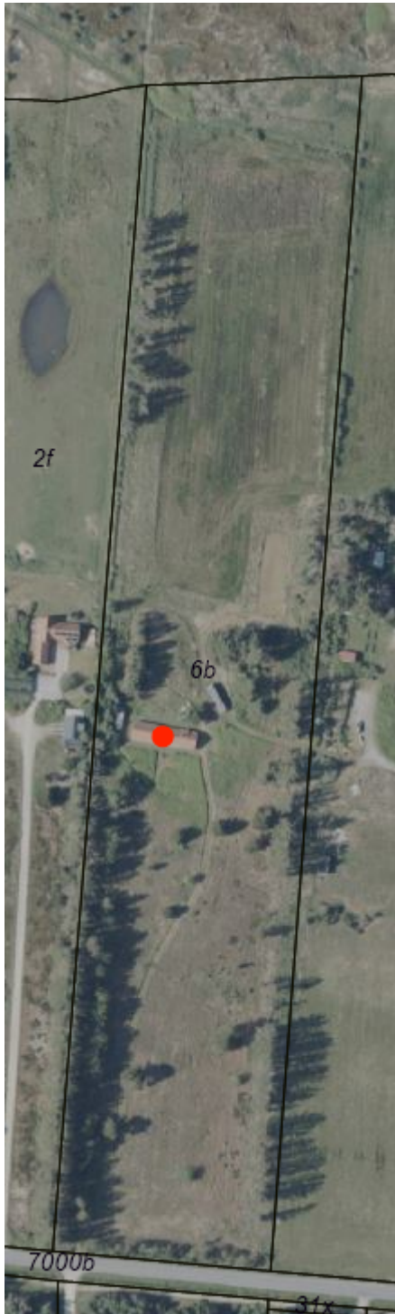
Figur 3: Luffoto sommer 2025 - ikke målfast