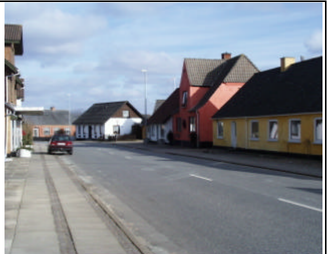
Eksempel på en række huse på Hovedgaden, hvor den oprindelige byggestil stort set er bevaret og hvor farvevalget er fint afstemt i skagengul, hvidkalket, teglrød og blank mur. Farvekort findes på Teknisk Forvaltning.