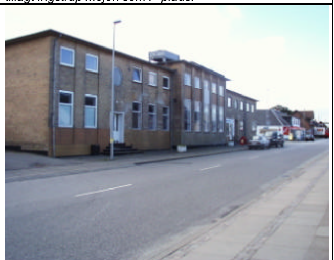
Ingstrup Mejeri på Hovedgaden.