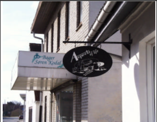
Eksempel på en renovering af en butiksfacade på Hovedgaden. Renoveringen passer til husets stil og skiltningen er diskret. Uheldigvis er skiltet domineret af en overflødig baldakin på nabohuset.