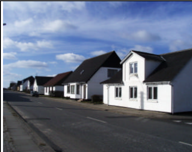
Eksempel på en række huse på Hovedgaden, hvor den oprindelige byggestil stort set er bevaret og taghældningen ligger mellem 40 og 50 grader.