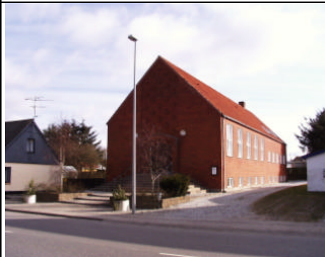
Baptistkirken på Hovedgaden er opført i 1956. Byggestilen er karakteristisk for tilsvarende kirkebyggerier fra den tid. Udvendig renovering og evt. tilbygning bør ske med respekt for den oprindelige byggestil.