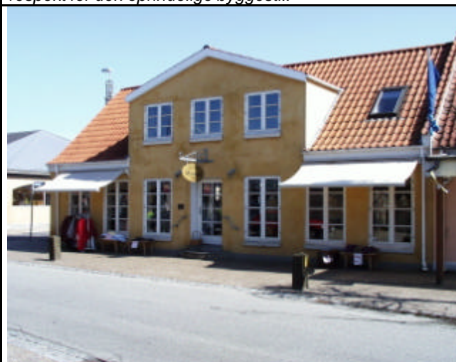
Eksempel på opsætning af markiser, der ikke virker skæmmende på forretningsjendommen.