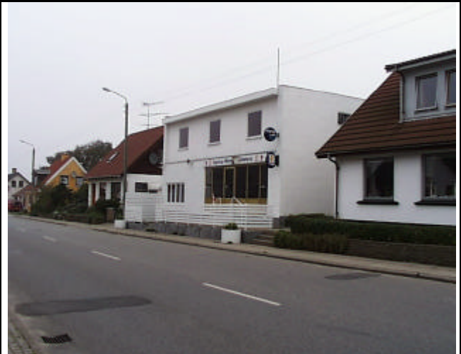
Ingstrup Cafeteria på Hovedgaden er et eksempel på en ombygning med en uheldig beklædning og et dominerende farvevalg, set i forhold til de omgivende huse.