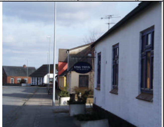
Bebyggelser langs Hovedgaden i en byggelinie på ca. 1 m fra vejskel. Bygningen med "Ung Tryk" vil blive nedrevet og grunden tillagt Ingstrup Mejeri som P-plads.