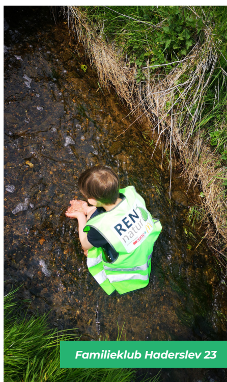
Familieklub Haderslev 23

Det er også her der skal lyde et stort TAK til Ølgod Efterskole, som donerede deres indsamlede midler indtjent ved den årlige 100 km gåtur rundt om Ringkøbing Fjord i 2022. Deres donation er anvendt netop til denne gruppe og vi er overbevist om, at det glæder alle elever og deres forældre at høre hvilken forskel, de har været med til at gøre.