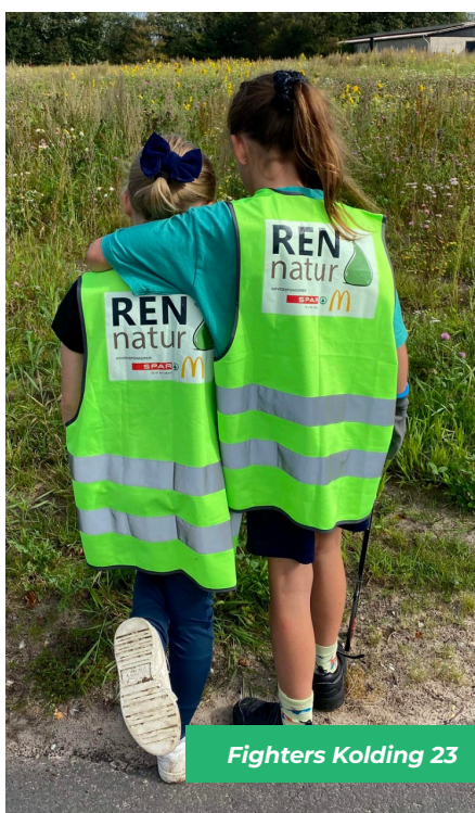
Fighters Kolding 23