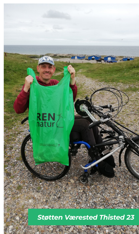
Støtten Værested Thisted 23