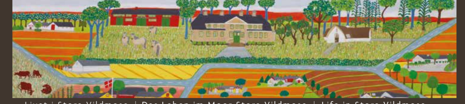
Livet i Store Vildmose | Das Leben im Moor Store Vildmose | Life in Store Vildmose