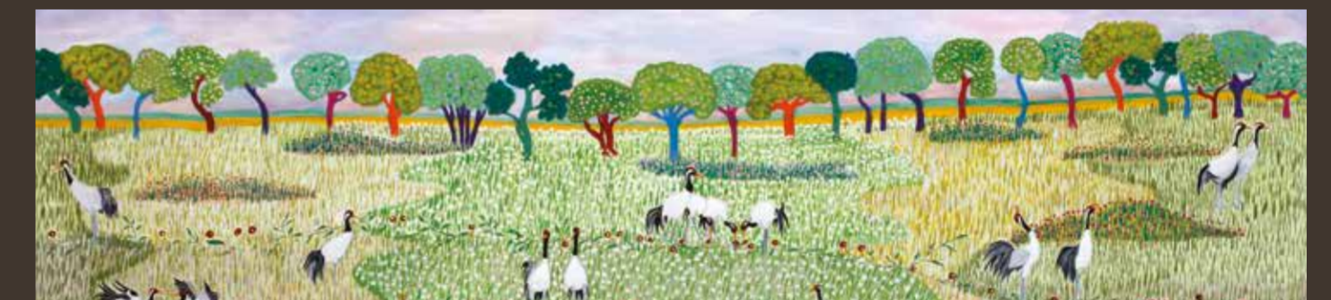
Mosen er farverig | Das Moor ist farbenfroh | The Moor is Colourful

EU CANAPÉ project to restore the bog together with the Netherlands, Belgium, Germany, England.