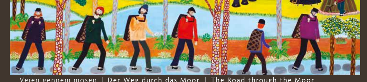
Vejen gennem mosen | Der Weg durch das Moor | The Road through the Moor