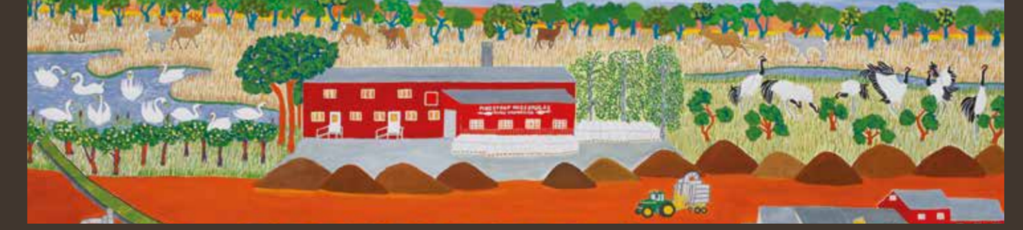
Høsten af mosen | Die Ernte des Moores | Harvesting the Moor