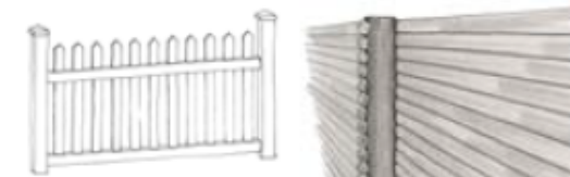
Spolestakit Skagen stakit