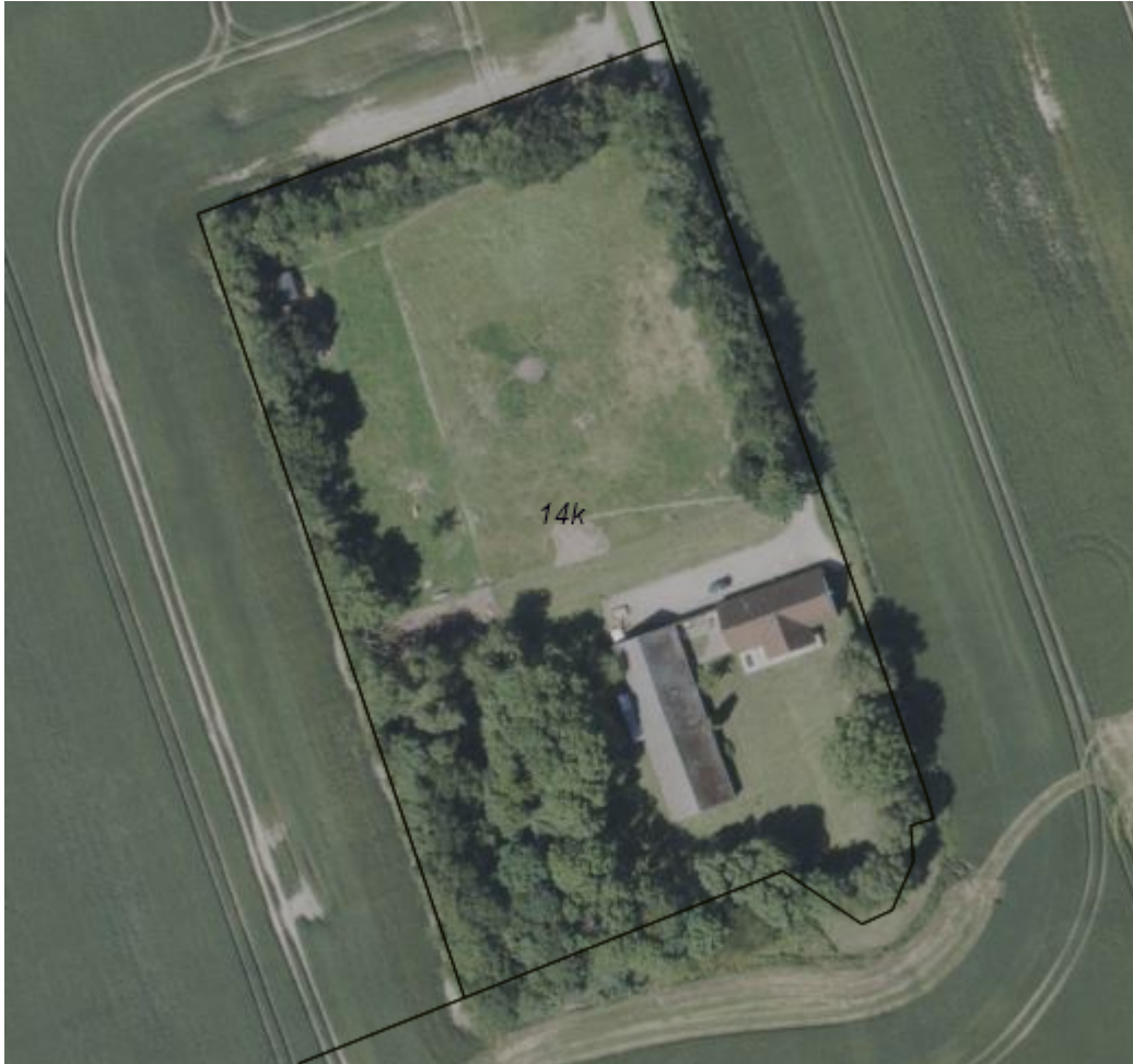
Figur 3: Luftfoto, sommer 2025 - ikke målfast