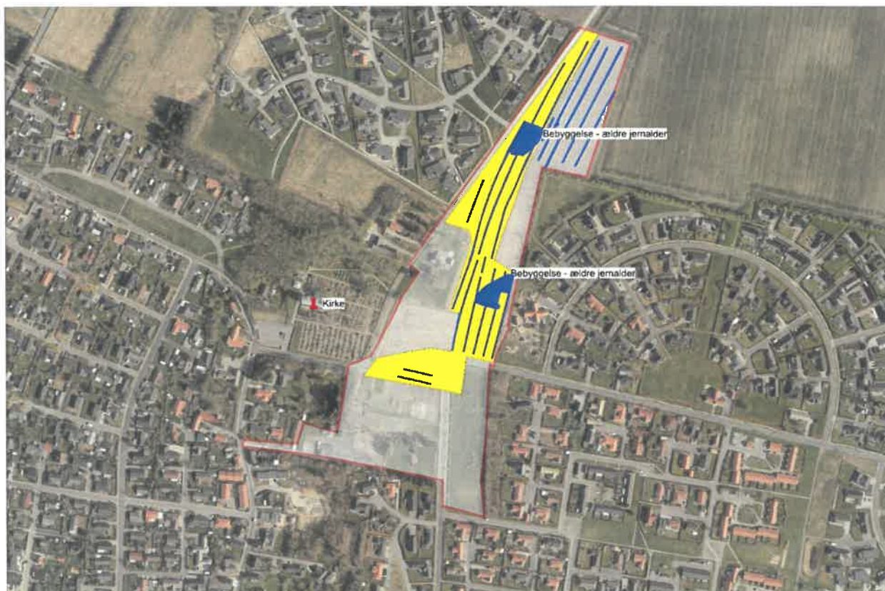
Fig. 1. Ortofoto med angivelse af planområdet (rød ramme), de tidligere undersøgte fundområder (blå) og arealet, som er blevet frigivet til anlægsarbejde efter de tidligere undersøgelser (gul).

Nordjyllands Historiske Museum skal hermed gøre opmærksom på, at museet kan have væsentlige arkæologiske interesser i det aktuelle planområde.