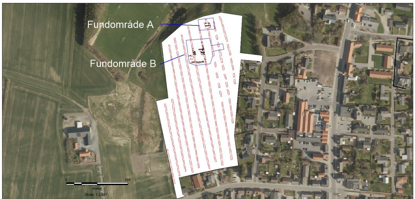
Fig 1. Luftfoto med angivelse af lokalplansområdet (hvid polygon), søgegrøfter og udvidelser (røde polygoner) og de to fundområder (blå polygon). Baggrundskort: ortofoto 2018.

Der er tidligere registreret en gravhøj i lokalplansområdets sydvestlige del. Denne kunne dog ikke genfindes ved forundersøgelsen, og højen er sandsynligvis fjernet ved markarbejde gennem de seneste 100 år