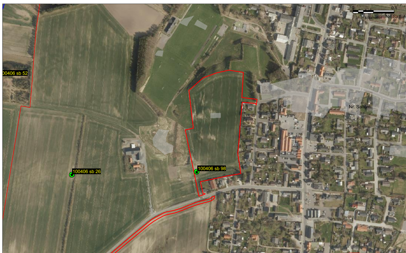
Figur 1 Den planlagte udstykning ved Saltum. Registreringer i F&F angivet med stednr. og sb-nr. Baggrundskort: Ortofoto 2018.

Nordjyllands Historiske Museum skal hermed gøre opmærksom på, at museet har væsentlige arkæologiske interesser inden for det aktuelle planområde. Der er således kendskab til en gravhøj inden for lokalplansområdet. Jf. museumsloven må området ved gravhøjen ikke byggemodnes før det er klarlagt om højen fortsat rummer væsentlige fortidsminder.