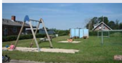
Legeplads i Gøttrup